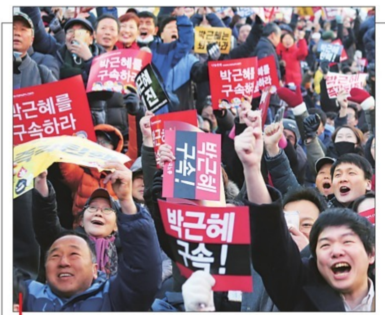
जीत दक्षिण कोरिया की राष्ट्रपति पार्क ग्युन हे के खिलाफ संसद में महाभियोग प्रस्ताव पारित होने के बाद खुशी का इज़हार करते लोग।

चार साल तक सत्ता में रहने के बाद अब ऐसी संभावनाएं पैदा हो रही हैं कि वे इतिहास में लोकतांत्रिक रूप से चुनी गई पहली ऐसी दक्षिण कोरियाई राष्ट्रपति के रूप में दर्ज हो सकती हैं, जिन्हें पद से हटाया गया। संसद में मतदान के बाद संसदीय अधिकारियों ने राष्ट्रपति भवन ब्यू हाउस को औपचारिक दस्तावेज सौंप दिए जिनमें कहा गया है कि पार्क को सत्ता से मुक्त किया जाए और सरकार में नंबर दो की हैसियत रखने वाले प्रधानमंत्री वांग क्यो-आन को तब तक नेतृत्व सौंपा जाए जब तक देश की संवैधानिक अदालत इस बारे में फैसला न कर दे कि पार्क को स्थायी तौर पर पद से हटाना होगा अथवा नहीं। अदालत को इस बारे में फैसला करने में छह महीने का समय होगा। महाभियोग के प्रस्ताव में पार्क पर संवैधानिक और आपराधिक उल्लंघनों का आरोप है।